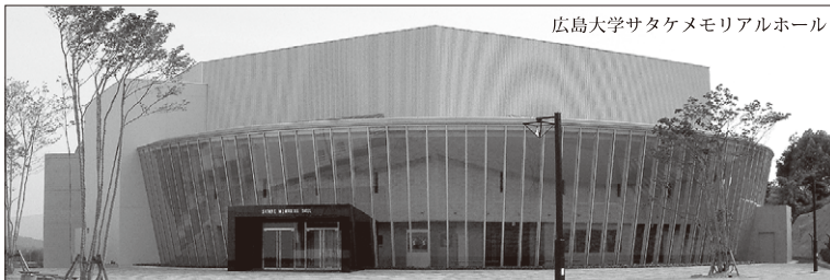
広島大学サタケメモリアルホール

昭和56年第十回上方お笑い大賞 金賞 昭和58年第十二回上方お笑い大賞 大賞 昭和58年第三回花王名人大賞 最優秀新人賞 昭和59年第十二回日本放送演芸大賞 奨励賞 昭和59年第四回花王名人大賞 最優秀名人賞 昭和59年第一回咲くよこの花賞 大衆芸能部門 (落語) 昭和60年第五回花王名人大賞 名人賞 平成14年大阪舞台芸術賞 平成21年芸術選奨文部科学大臣賞 大衆芸能部門 平成22年紫綬褒章 平成26年第四十九回 大阪市市民表彰 文化功労部門 など